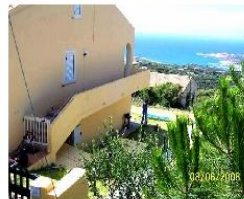
Foto interno 1